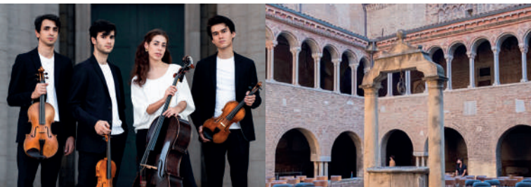
Chiostro della Basilica di Santo Stefano

Il ciclo di concerti "Talenti" è inserito nella rassegna pianofortissimo & TALENTI