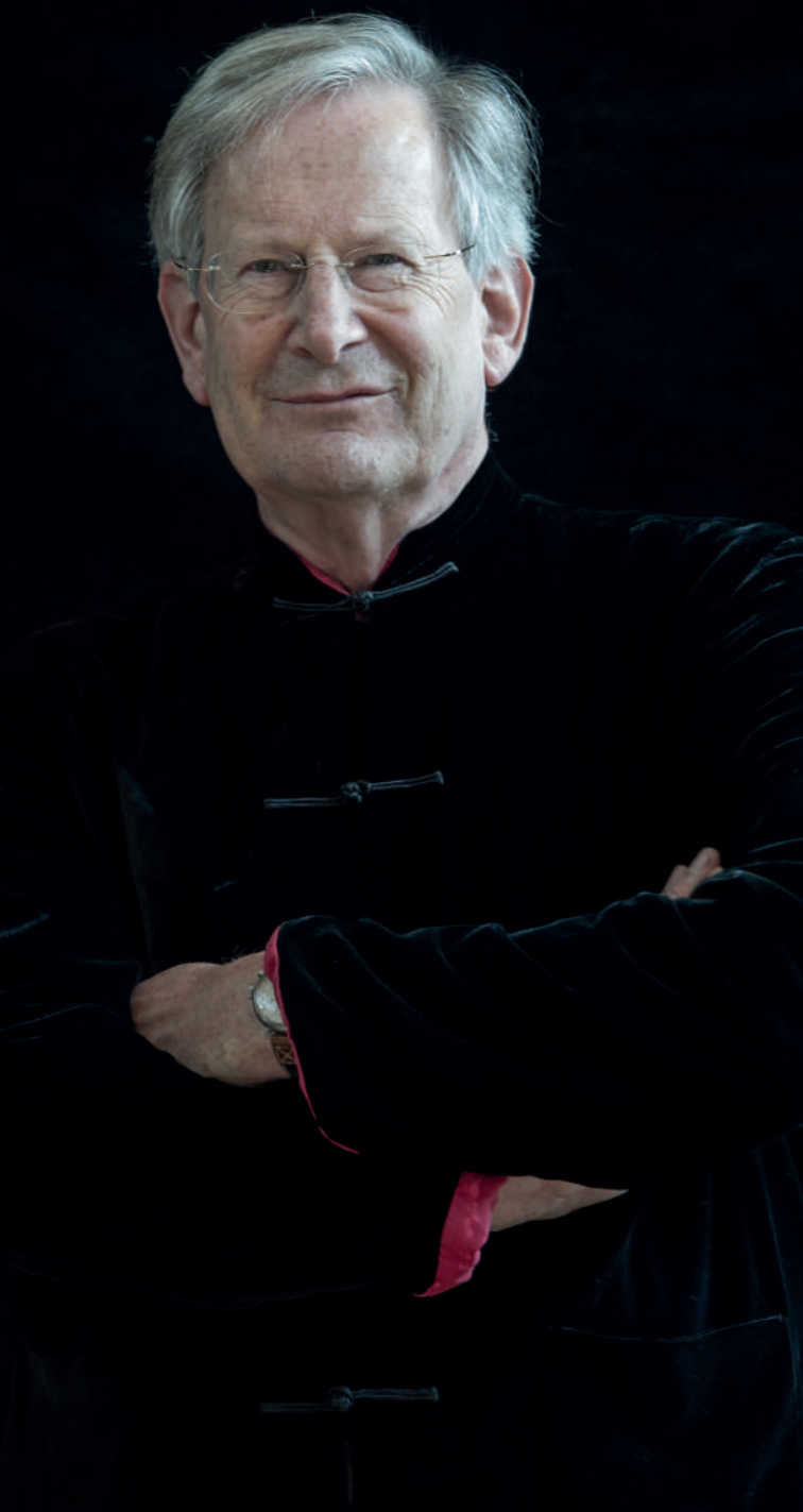
John Eliot Gardiner