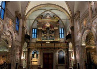
Chiesa di San Michele in Bosco